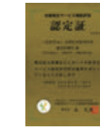
労働衛生機関 評価認定施設