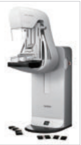
マンモグラフィ装置