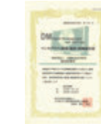
マンモ施設画像認定証